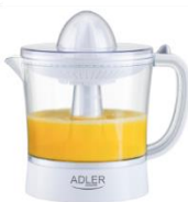
CITRUS JUICER AD 4009