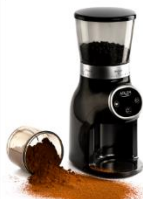
Burr Coffee Grinder AD 4450