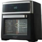
AIR FRYER OVEN AD 6309