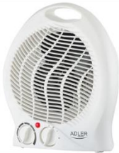
FAN HEATER AD 7728