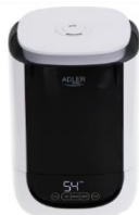
AIR HUMIDIFIER AD 7966