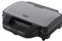
SANDWICH MAKER AD 3043