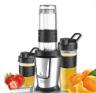
PERSONAL BLENDER AD 4081