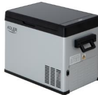
PORTABLE FRIDGE AD 8077