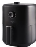
AIR FRYER AD 6310