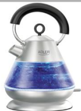
Electric Kettle AD 1282