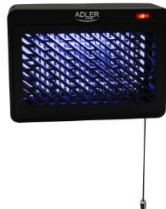
MOSQUITO LAMP AD 7938