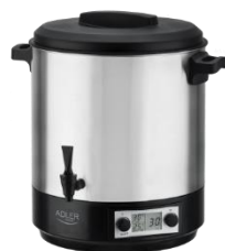
PASTEURIZATION POT AD 4496