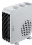
FAN HEATER AD 7725