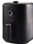
AIR FRYER AD 6310