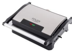
ELECTRIC GRILL AD 3052