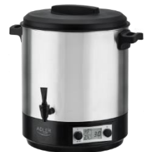
PASTEURIZATION POT AD 4496