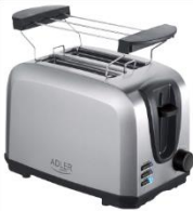
TOASTER 2 SLICE AD 3222