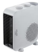
FAN HEATER AD 7725