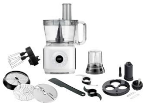
FOOD PROCESSOR AD 4224