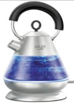
Electric Kettle AD 1282