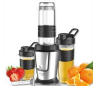
PERSONAL BLENDER AD 4081