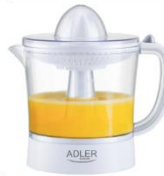
CITRUS JUICER AD 4009