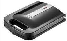
Sandwich Maker AD 3055