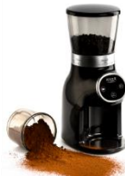
Burr Coffee Grinder AD 4450