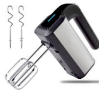
MIXER AD 4225