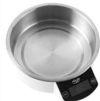
KITCHEN SCALE AD 3166