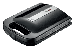
Sandwich Maker AD 3055