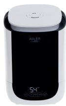
AIR HUMIDIFIER AD 7966