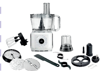
FOOD PROCESSOR AD 4224