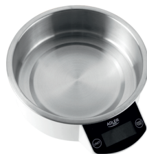
KITCHEN SCALE AD 3166