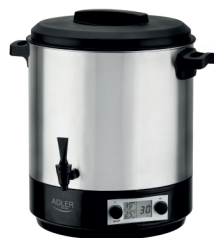
PASTEURIZATION POT AD 4496