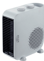
FAN HEATER AD 7725