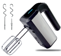
MIXER AD 4225