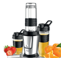
PERSONAL BLENDER AD 4081