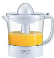
CITRUS JUICER AD 4009