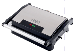
ELECTRIC GRILL AD 3052