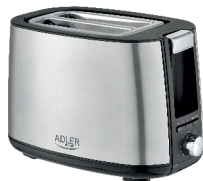
TOASTER 2 SLICE AD 3214