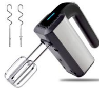
MIXER AD 4225