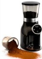
Burr Coffee Grinder AD 4450