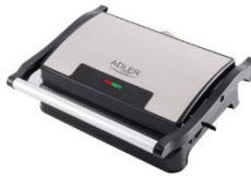
ELECTRIC GRILL AD 3052