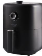
AIR FRYER AD 6310