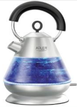
Electric Kettle AD 1282