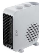
FAN HEATER AD 7725