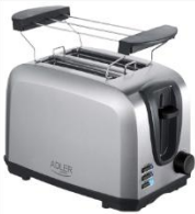
TOASTER 2 SLICE AD 3222