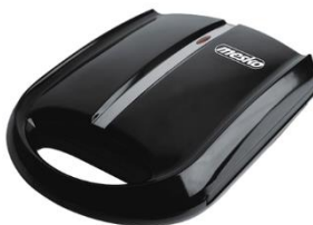
NUT MAKER MS 3041