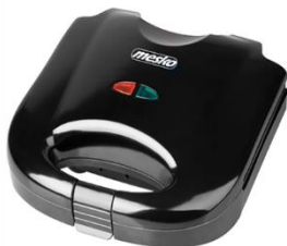
SANDWICH MAKER MS 3032