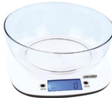
KITCHEN SCALE MS 3165