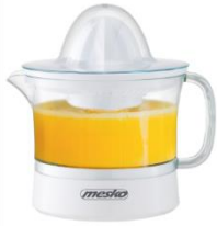
CITRUS JUICER MS 4010