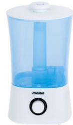
AIR HUMIDIFIER MS 7965