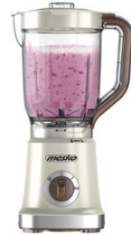
BLENDER WITH JAR MS 4079