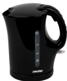
ELECTRIC KETTLE MS 1284