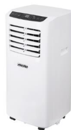
AIR CONDITIONER MS 7911