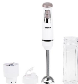
HAND BLENDER MS 4624