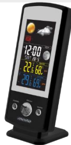
Weather Station MS 1177