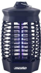
MOSQUITO KILLER LAMP MS 7933