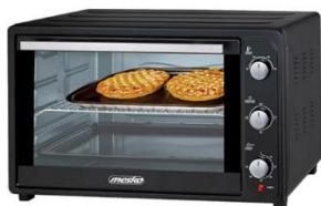
ELECTRIC OVEN MS 6021