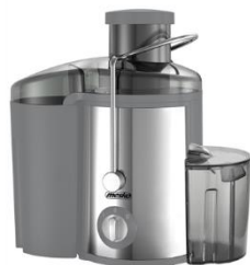
JUICE EXTRACTOR MS 4126