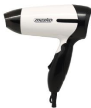
HAIR DRYER MS 2262