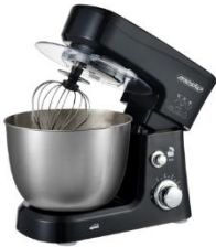
MIXER WITH BOWL MS 4217