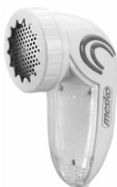
lint remover MS 9607