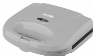
sandwich maker MS 3029