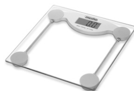
bathroom scale MS 8137