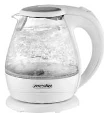
electric kettle MS 1245