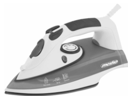
steam iron MS 5016