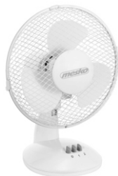
table fan MS 7308