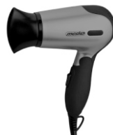
hair dryer MS 2229