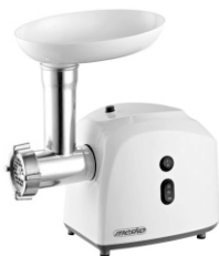
meat grinder MS 4805