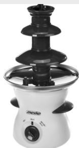
3-level chocolate fountain MS 4467