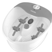
foot spa MS 2152