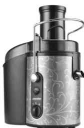
juice extractor MS 4112