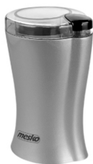
coffee grinder MS 4440