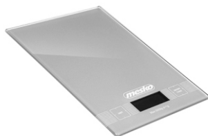
kitchen electronic scale MS 3145