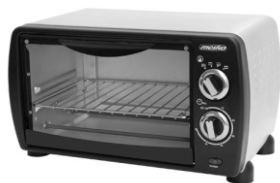
electric oven MS 6004