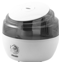
air humidifier MS 7955