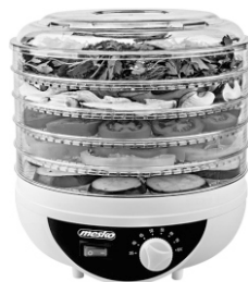
food dryer MS 6656