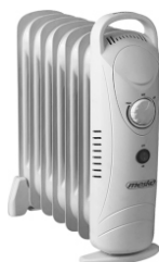
oil heater MS 7804