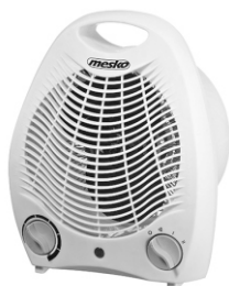
fan heater MS 7704