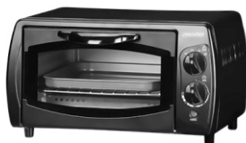
electric oven MS 6013