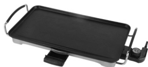
electric grill MS 6605