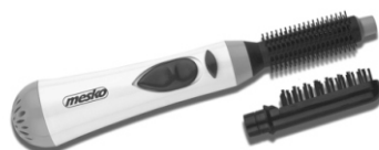
hair styler MS 2016